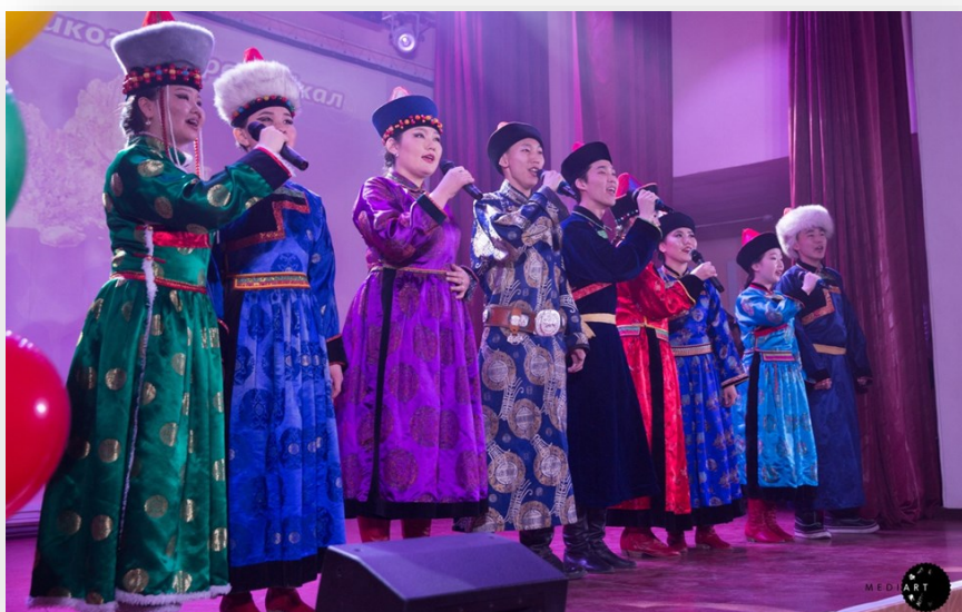
Вокальная группа БНСА «Ургы» Выступление на Гала-концерте