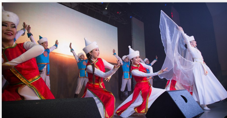
БНСА «Ургы» дипломаты 2 степени регионального этапа конкурса-фестиваля «Студенческая весна — 2018» в номинации «Народный танец (ансамбль)»

За время своего существования ансамбль добился немалых успехов и приобрёл ши-